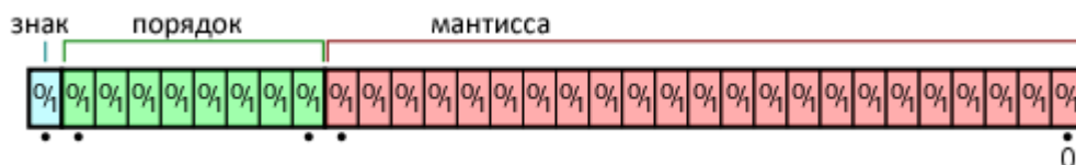
Рис.1. Представление числа с плавающей запятой.

Если исключить все ошибки разработчика программы, связанные с неверной реализацией алгоритма, то ошибки в вычислениях могут появляться из-за округления в самой системе, т.к. любая компьютерная система не может быть бесконечно точной. Причиной такого рода ошибок является ограничение памяти и разрядности процессора. К примеру, в обычной арифметике, между нулем и единицей существует бесконечное количество вещественных чисел, а компьютер из-за своей ограниченной разрядности памяти может хранить и использовать только ограниченное количество чисел. В таких случаях компьютеру приходится их округлять. Для представления таких чисел, была введена система чисел с плавающей запятой, что является компромиссом между точностью вычислений и скоростью работы. Число с плавающей запятой состоит из набора отдельных разрядов, условно разделенных на знак, порядок и мантиссу [2]. Порядок и мантисса — целые числа, которые вместе со знаком дают представление числа с плавающей запятой (рис. 1).