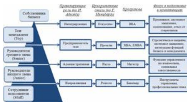
Рис. 2. База для понимания разницы в компетенциях, обеспечиваемых подготовкой менеджеров по программам разных уровней (кликните по изображению, чтобы увеличить его).

Представляется, что при подготовке менеджеров разных уровней в системе непрерывного профессионального образования следует делать различные акценты на ролях, стилях, навыках и компетенциях, необходимых тому или иному управленческому звену (рис. 2).