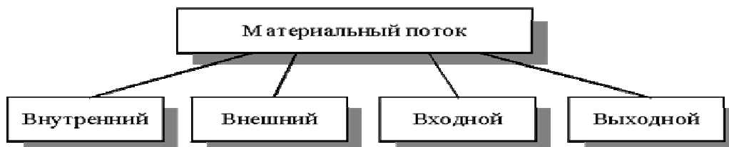
Рис. 2. Виды материальных потоков.

Как отмечалось, материальный поток образуется в результате совокупности определенных действий с материальными объектами. Эти действия называют логистическими операциями. Однако понятие логистической операции не ограничивается действиями лишь с материальными потоками, именно: операцию сопровождает информация, документооборот и конкретное управленческое решение. Таким образом, для управления материальным потоком необходимо принимать, обрабатывать и передавать информацию, соответствующую этому потоку. Выполняемые при этом действия также относят к логистическим операциям.