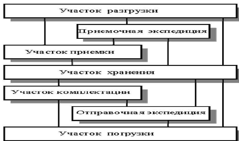
Рис. 1. Схема материального потока на торговой оптовой базе.

Различают входной и выходной материальные потоки. Входной материальный поток поступает в логистическую систему из внешней среды. Выходной материальный поток поступает из логистической системы во внешнюю среду. Для оптовой базы его можно определить, сложив материальные потоки, имеющие место при выполнении операций по погрузке различных видов транспортных средств.